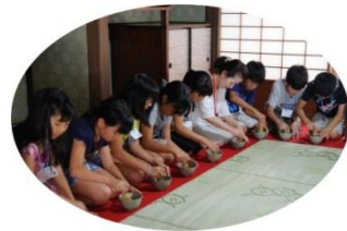
写真：昨年のキッズサマースクールの様子