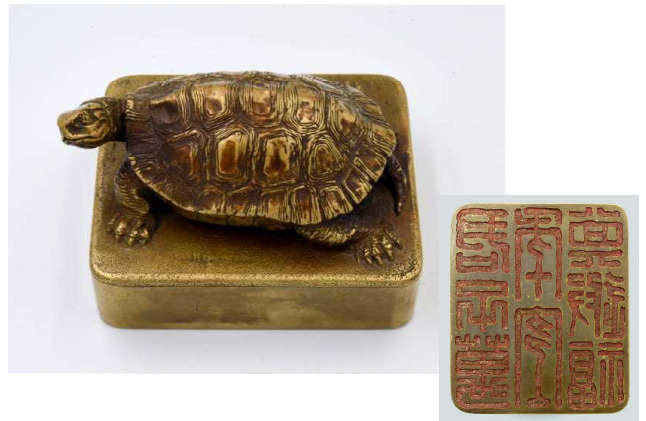
【底部銘「君子万年宜其遐福」】

文鎮は、紙押さえとも呼ばれる文房具で、紙などが風で飛ばないように、上にのせて重しとする道具です。