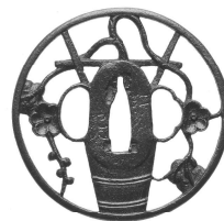
生花透鐔 銘 江州記内

鐔は刀を持つ手を保護する刀装具の一種です。室町時代以降、実用を超えて金象嵌や透かし彫りなどの金工技術が凝らされた、多様な意匠の鐔が作られました。本展では、井伊家伝来品を中心に館蔵の鐔を紹介します。