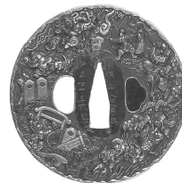
武者合戦図鐔 銘 藻樹子入道宗典