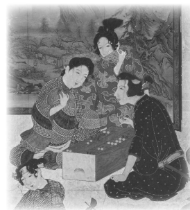
風俗図(彦根屏風)(部分)

数ある井伊家伝来品中の白眉、彦根屏風を特別公開。華やかで緻密な賦彩、計算し尽くした構図、画中に潜む知的な見立てなど、多様な魅力を持ち、近世初期風俗画の傑作として知られています。