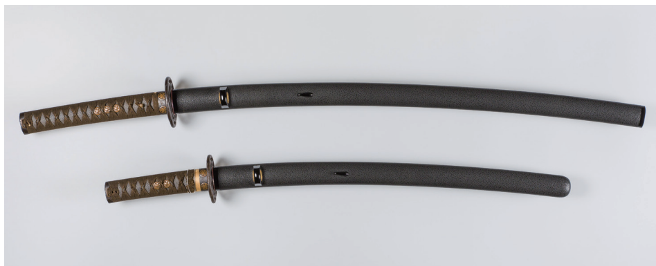
写真1 黒漆塗鞘大小拵 当館蔵